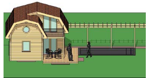
Verbaute Fläche: 43,4m 2