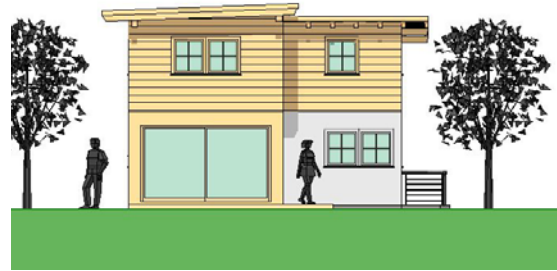
Verbaute Fläche: 48m 2