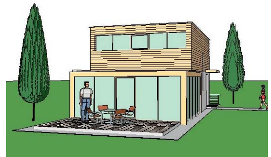
Verbaute Fläche: 48,72m 2